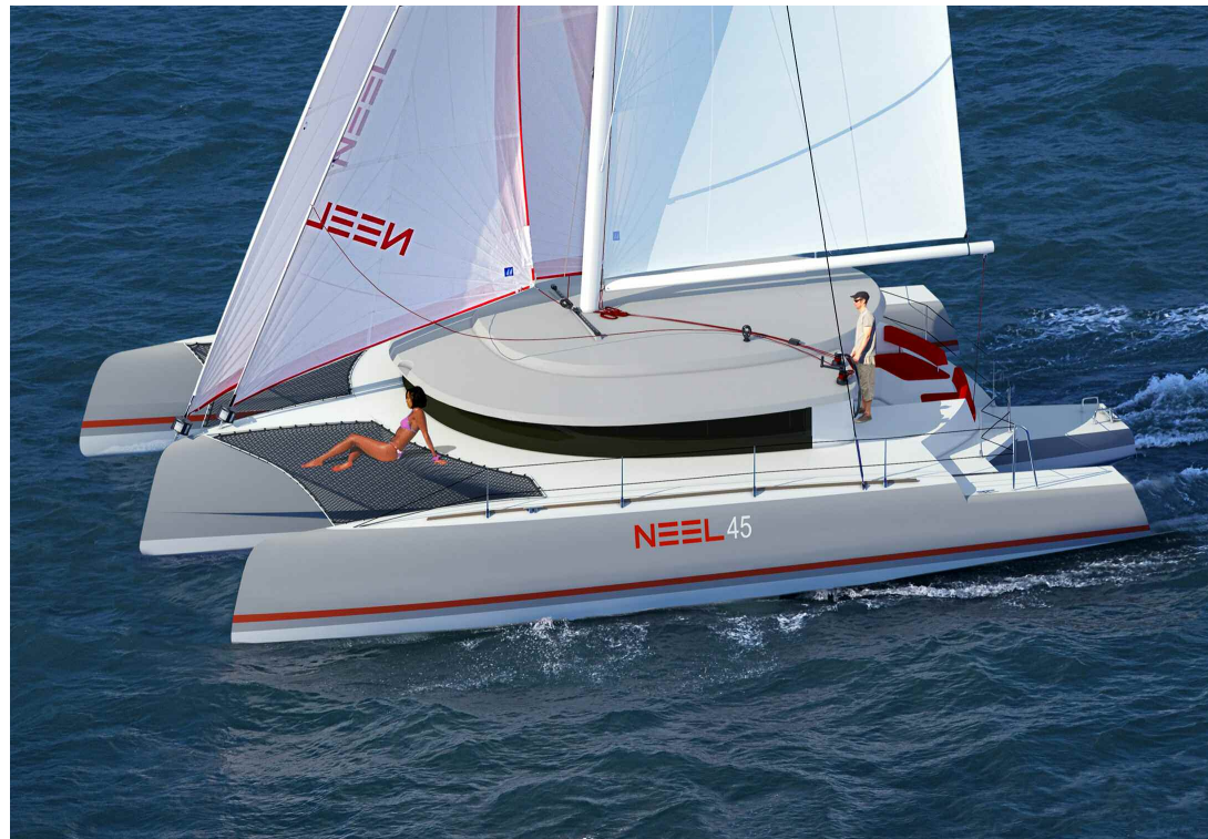
Architectes / Ship designers : JOUBERT-NIVELT-MERCIER - Conception : Eric Bruneel

Côté navigation, une innovation : les étraves inversées limiteront le tangage et autoriseront une longueur de flottaison maximale (13,50m).